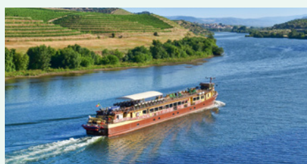
Sie fahren mit der Spirit of Chartwell.

Gern unterbreiten wir Ihnen ein Angebot für eine individuelle Vorreise in Lissabon und eine Verlängerung in Porto. Wir freuen uns auf Ihre Anfrage!