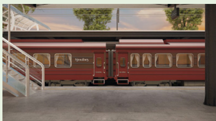
Sie fahren mit dem Sonderzug SJourney.

Kombinieren Sie Ihre Reise mit einem Aufenthalt in der faszinierenden Bergregion Sapa oder erholsamen Tagen an den herrlichen Stränden auf Phu Quoc! Gerne machen wir Ihnen ein Angebot.