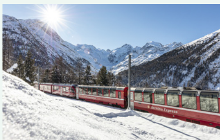
Sie fahren u. a. im Bernina Express.

„Eine Zugfahrt durch die malerischen, schneebedeckten Landschaften der Schweiz ist ein wahrhaft magisches Erlebnis.“