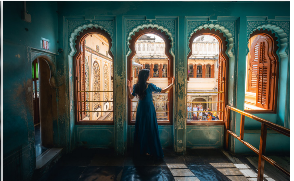
Inderin in klassischem Sari