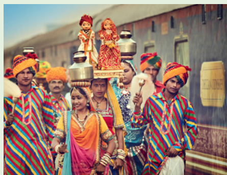
Sie fahren mit dem Deccan Odyssey.

„Das Klingelton-Prinzip: Hofmusiker signalisierten dem Mogul-Kaiser mit einer bestimmten Melodie, wer sich gerade zur Audienz einfand.“