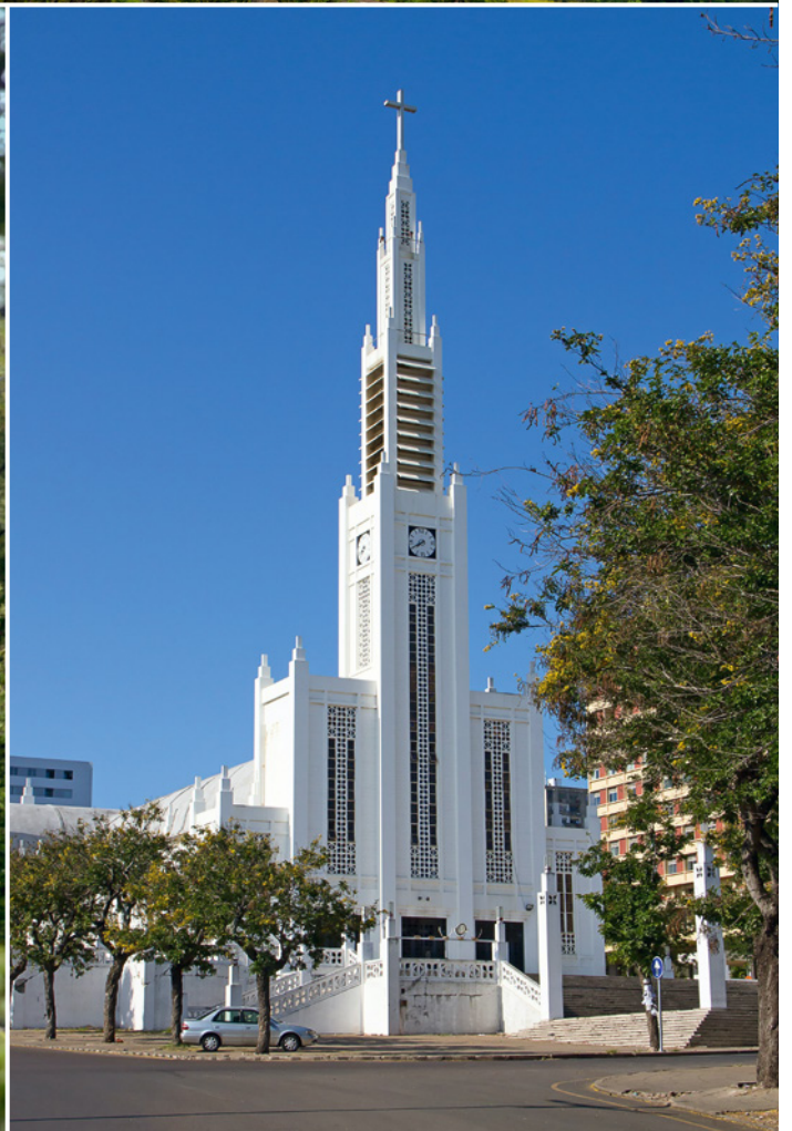
Moderne katholische Kathedrale in Maputo