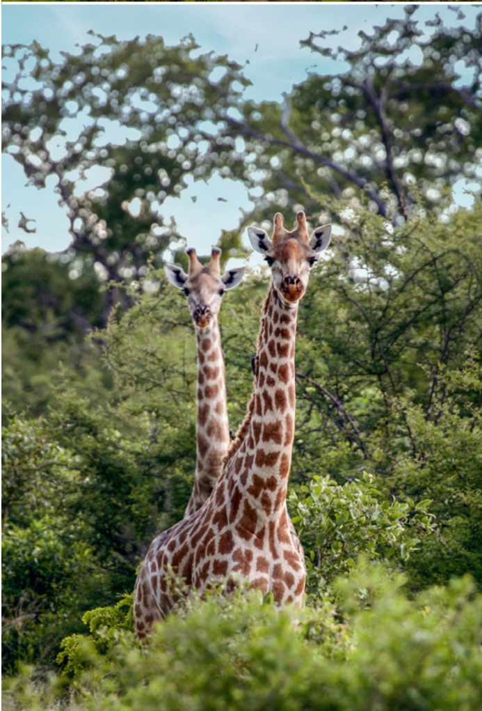
Tierbeobachtung im Hwange-Nationalpark