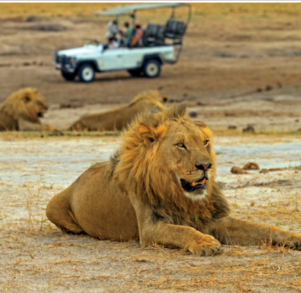
Löwe im Hwange-Nationalpark