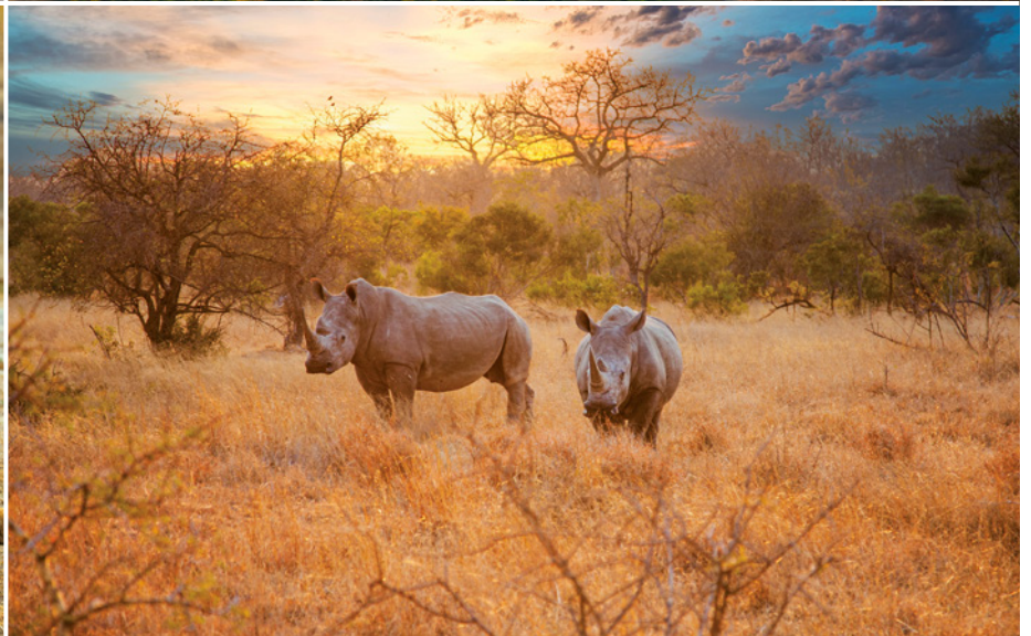
Nashörner im Krüger-Nationalpark

5. Tag Cecil Rhodes' Grab Am Vormittag erwartet Sie eine Rundfahrt durch Bulawayo. Alternativ können Sie das Naturhistorische Museum oder das Nationale Eisenbahn-Museum besuchen, das historische Waggons beherbergt, die mit Leidenschaft restauriert und präsentiert werden. Anschließend geht es in den Matobo-Nationalpark. Hier besuchen Sie das Grab des britischen Eroberers und Politikers Cecil Rhodes und treffen dort einen Ranger, der Ihnen eindrucksvoll vom Leben im Nationalpark berichtet. Bei Sonnenuntergang genießen Sie den Blick auf die runden Felsen, die in sämtlichen Regenbogenfarben leuchten. Zum Abendessen werden Sie an Bord erwartet. (FA)