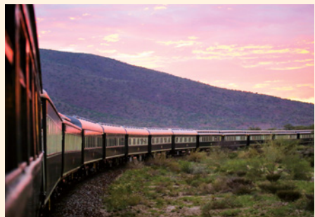
Sie reisen mit dem Sonderzug African Explorer.

„Ein Muss für Eisenbahn-Fans: Garratt-Dampfloks und Rhodes' originaler Salon-Wagen im Bahn-Museum von Bulawayo.“