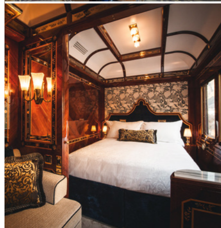
Grand Suite, darüber: Erstklassiger Service