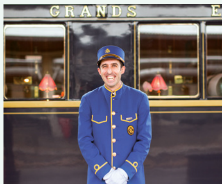
Sie fahren im originalen Venice Simplon-Orient-Express.