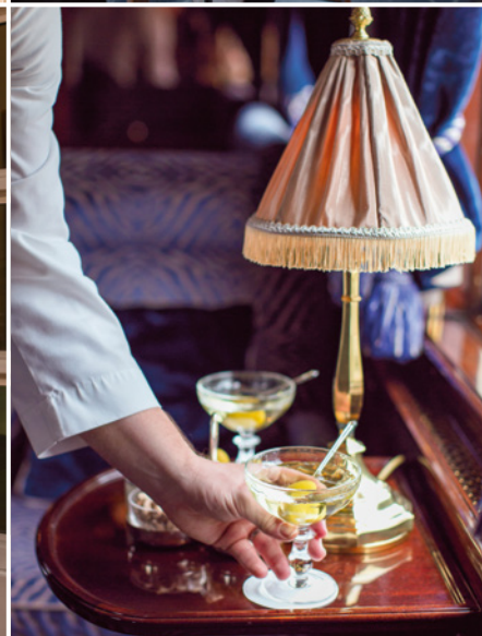
Sie starten in Paris