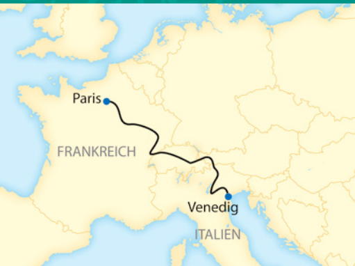
Der Venice Simplon-Orient-Express auf seinem Weg durch Österreich