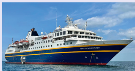
Sie fahren mit der Heritage Adventurer.

„Schon gewusst? Knapp 600.000 Neuseeländer, rund 15 % der Bevölkerung, zählen sich zu den Māori.“