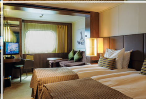
Superior-Kabine auf Deck 5