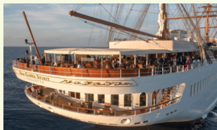
Lido-Deck der Sea Cloud Spirit