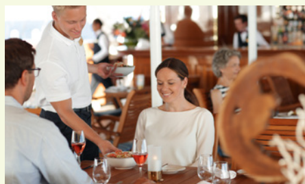
Sie fahren mit der Sea Cloud Spirit.

„Costa Rica ist zu Recht das Lieblingsland aller Naturliebhaber in Mittelamerika. Die üppigen Nationalparks regen zum Träumen an.“