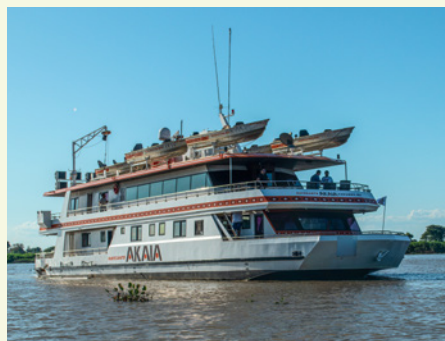
Sie fahren mit der MS Akaia.

„Nirgendwo sonst gibt es so viele Jaguare wie in den Feuchtgebieten im Südwesten Brasiliens.“