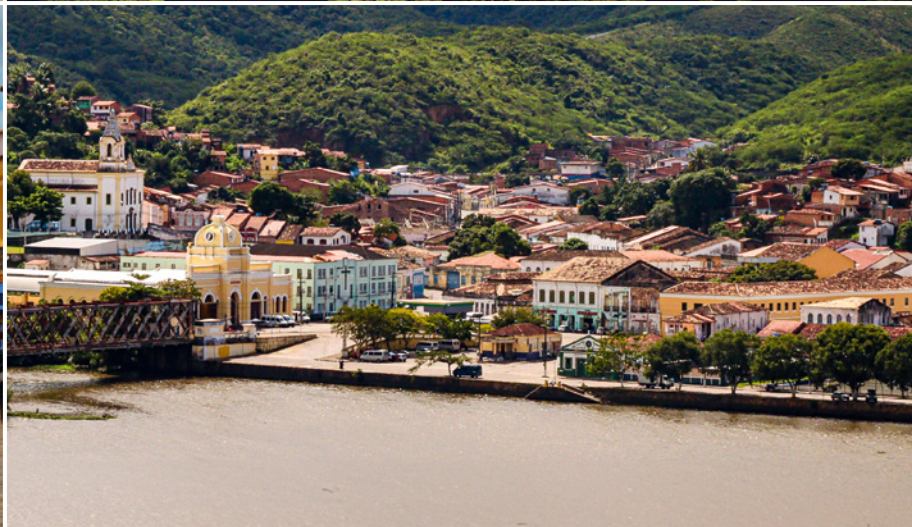
In den bunten Gassen von Salvador (UNESCO-Welterbe)