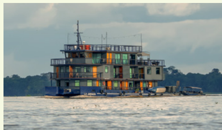
Sie fahren mit der MS Jangada.

„Extrem üppige Artenvielfalt – drei Wörter, die den Superlativ des Pantanals am besten beschreiben!“