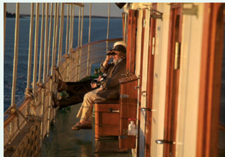
Sie fahren mit der MS Diana.

„Als Bordlektüre empfehle ich die Kommissar Beck-Krimis. Schauplatz des ersten Falls ist Ihr Schiff – die MS Diana.“