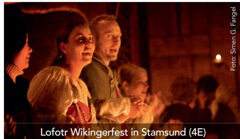
Lofotr Wikingerfest in Stamsund (4E)

Verleihen Sie Ihrer Hurtigruten Reise eine ganz individuelle Note – und kommen Sie Norwegen während abwechslungsreicher Landausflüge so nah wie nie zuvor. Die angegebenen Termine beziehen sich auf die Durchführungsdaten vor Ort. Weitere Informationen, auch zu den unterschiedlichen Schwierigkeitsstufen der Ausflüge, erhalten Sie in Ihrem Reisebüro, unter www.hurtigruten.de oder im aktuellen Katalog.