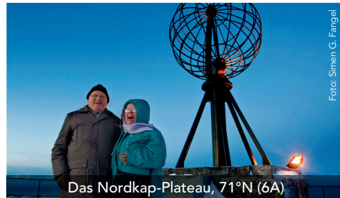
Das Nordkap-Plateau, 71°N (6A)