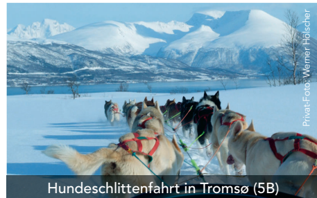
Hundeschlittenfahrt in Tromsø (5B)