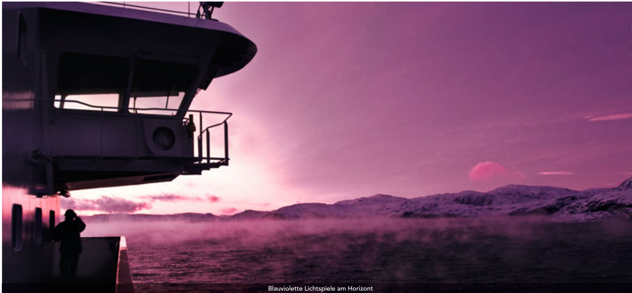
Blauviolette Lichtspiele am Horizont