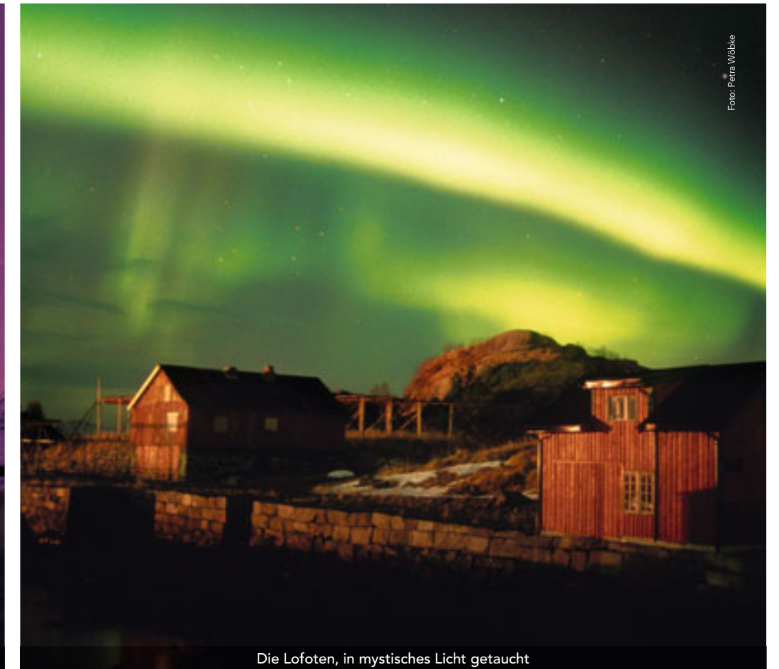
Die Lofoten, in mystisches Licht getaucht