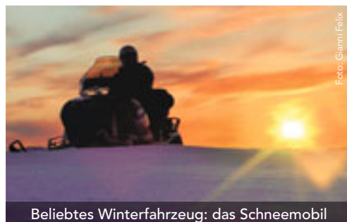
Beliebtes Winterfahrzeug: das Schneemobil