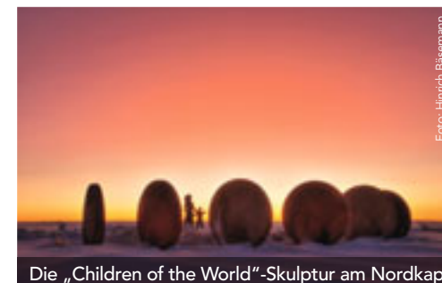
Die „Children of the World“-Skulptur am Nordkap