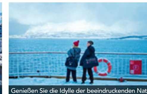
Genießen Sie die Idylle der beeindruckenden Natur