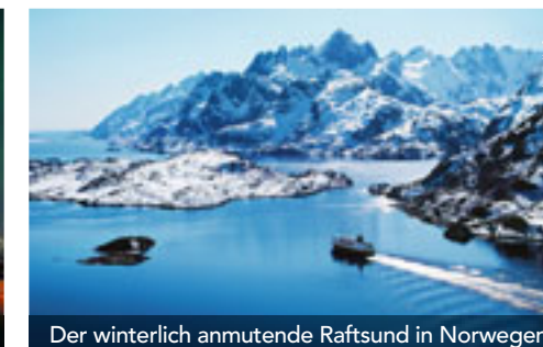
Der winterlich anmutende Raftsund in Norwegen