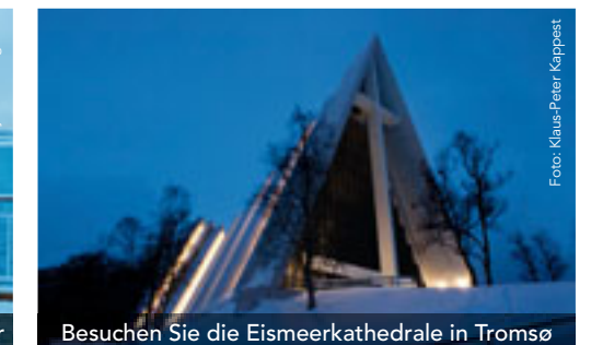
Besuchen Sie die Eismeer-Kathedrale in Tromsø